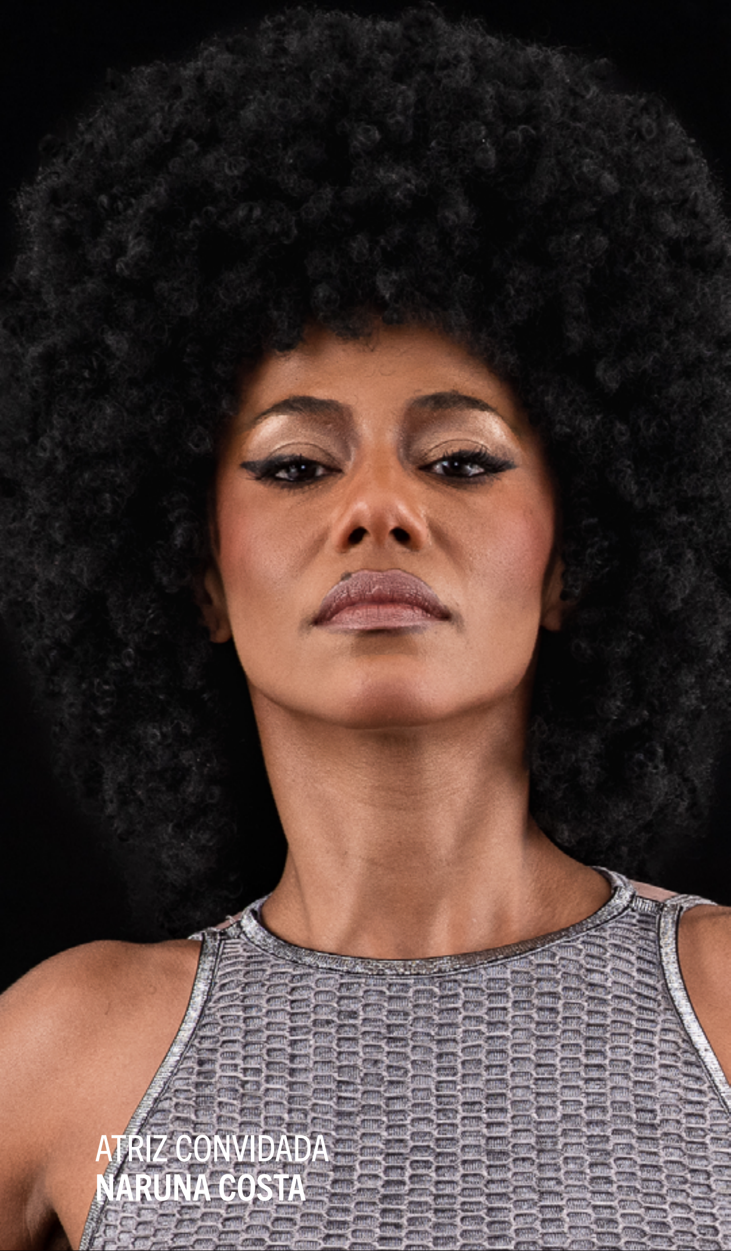
ATRIZ CONVIDADA NARUNA COSTA